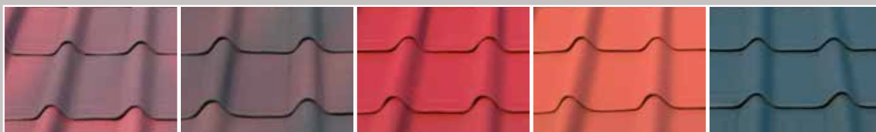
3T (třítonová) červená 3T (třítonová) hnědá červená